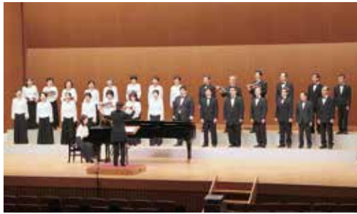
↑ 15年ぶりに『交声曲 伊万里』を披露する伊万里合唱団

6月24日、市民センターで伊万里合唱団の32回目の定期演奏会がありました。昭和35年に産声を上げた同合唱団。現在は男性14人、女性18人で活動しています。今回は、15年ぶりに披露する『交声曲 伊万里』をはじめ、男声による歌謡曲のコーラスやゲストによるアイリッシュ・ハーブの演奏、オペラ・リア曲の合唱など、多様な趣向を凝らしたステージを演出。安定感のある魅惑の歌声に、観客からは大きな拍手が贈られました。