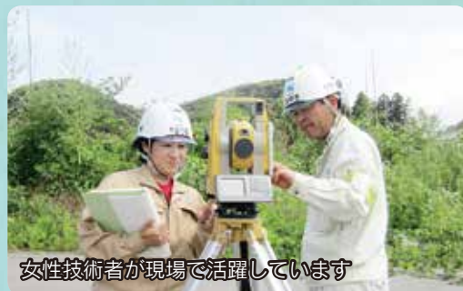
女性技術者が現場で活躍しています