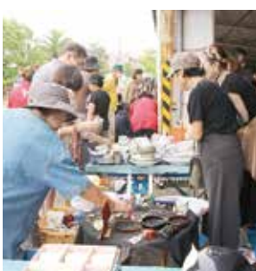
↑昨年のリサイクルフェアの様子