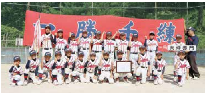
↑ 優勝を喜ぶ大坪赤門少年野球部の選手たち