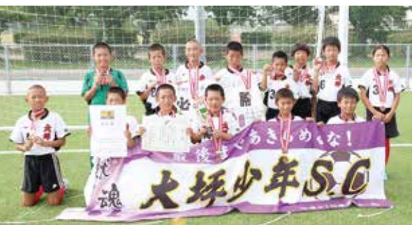
↑ 5年連続で3位入賞を果たした大坪少年サッカークラブ