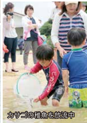
カサゴの稚魚を放流中