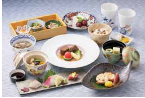
↑フェアで提供される料理の例

● 期間 8月1日(水)～9月30日(日) ● 場所 西鉄グランドホテル(福岡市中央区大名2丁目)