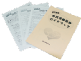
↑市民活動団体の情報を取りまとめたハンドブックと広報紙