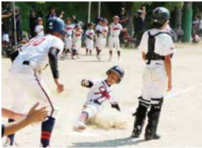
↑ 延長9回の死闘にピリオドを打つ決勝点のホームイン