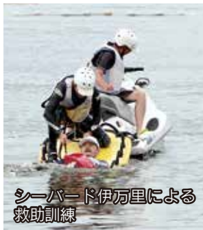
シーバード伊万里による救助訓練