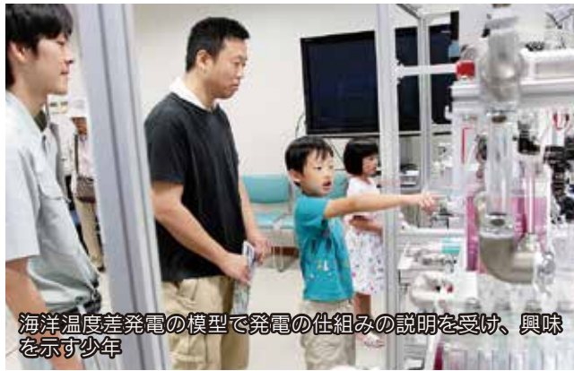
海洋温度差発電の模型で発電の仕組みの説明を受け、興味を示す少年

佐賀大学海洋エネルギー研究センター伊万里サテライトで施設見学会がありました。洋上風力発電や海洋温度差発電についての公開講座や、波力発電の模型を使つての発電実験など、海洋エネルギーについての研究の成果が楽しく学べるとあって、親子連れなど多くの人たちが訪れました。水素で走る燃料電池自動車の試乗会もありました。