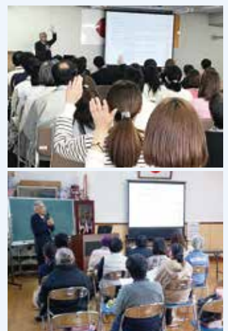
↑職場や地域での講座の様子

まずは、生涯学習課（☎23-3186）までお電話ください。（希望日の2週間前までをお願いします） できるだけ希望の日時に講師を派遣します。日時などが決定した後、派遣依頼書を提出していただきます。