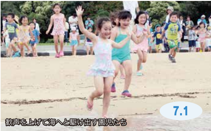
歓声を上げて海へと駆け出す園児たち