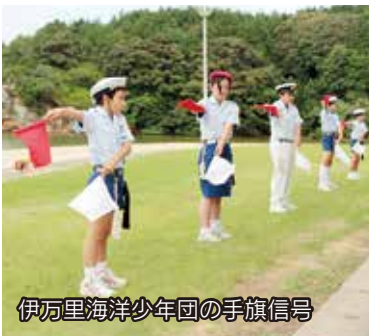
伊万里海洋少年団の手旗信号

イマリンビーチで海開きがありました。地元福田区による安全祈願の神事のあと、伊万里海洋少年団の手旗信号やシーバード伊万里による救助訓練が披露されました。続いての初泳ぎでは、今か今かと待ち構えていた地元の幼稚園と保育園の園児たちが一斉に海に入って水遊び。稚エビやカサゴの稚魚の放流も体験し、楽しい夏の日を過ごしました。