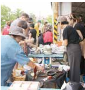
↑昨年のリサイクルフェアの様子