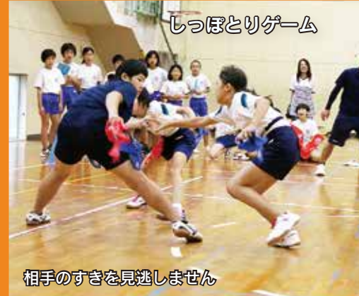
しっぽとりゲーム