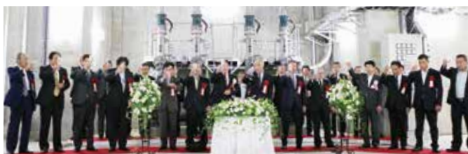
新施設で浄化された水で乾杯する関係者