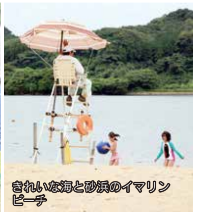
きれいな海と砂浜のイマリンビーチ