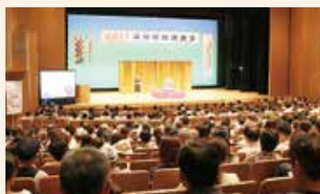
↑ 昨年の同和問題講演会の様子