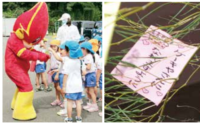
↑キュートくんが短冊を読んで感心しています