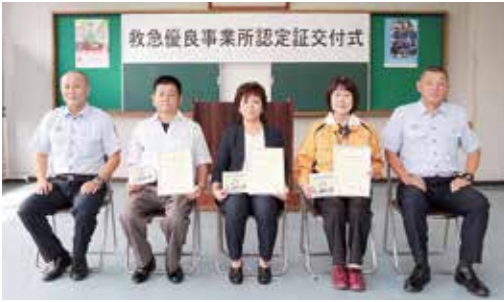
↑迅速な通報や適切な応急手当ができること新たに認定を受けた事業所の皆さん

9月11日、伊万里・有田消防本部で、救急優良事業所認定証交付式があり、伊万里・有田地区の3事業所が新たに認定されました。 ◆今回認定された事業所 ▽伊万里・有田地区特別養護老人ホームくみにみ（有田町） ▽デイサービス癒赤坂（有田町） ▽伊万里市東部デイサービスセンター・ユートピア（大川町）