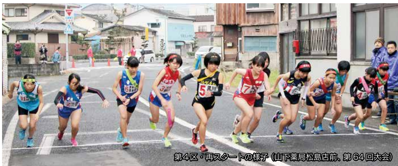
第4区・再スタートの様子 (山下薬局松島店前、第64回大会)