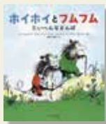
『ホイホイとフムフム』 マジョリー・ワインマン・シャーマット/文 バーバラ・クーニー/絵 福本友美子/訳 ほるぷ出版

オポッサムのホイホイは、友だちのフムフムの家に行きました。「お茶にしよう」というフムフムに、ホイホイは「散歩に行こう」と誘います。そして散歩のしかたを教えてくださいました。フムフムは、一度も散歩をしたことがないので、フムフムは散歩の前に、お茶を入れてくれました。そして窓から外を眺めました。「大事なものは、ゆつたりのおんびりすること。やつと二人は散歩に出かけますか。」