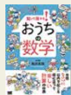
『知って得する! おうちの数学』 松川文弥/著 翔泳社

ふだんの生活の中には、意外に算数や数学があふれています。例えば、ケーキなど円形の食べ物や、移動の際の最短距離を知りたいときなど…。この本には、そんな身近な事柄が算数と数学の知識を使って紹介されています。より得するポイントの貯め方などを知ること、これまでの生活が得な毎日に生まれ変わるかもしれない。暮らしに生かしたい数学の知識が詰まった一冊です。