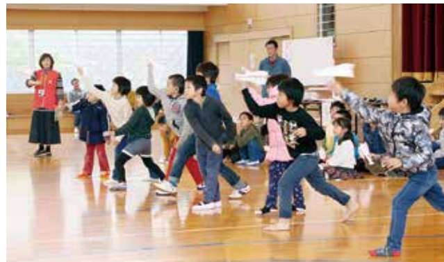
↑ 自分で作った紙飛行機で、飛行距離を競う子どもたち