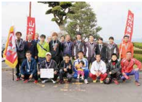
↑ 念願の優勝を果たした山代町チーム