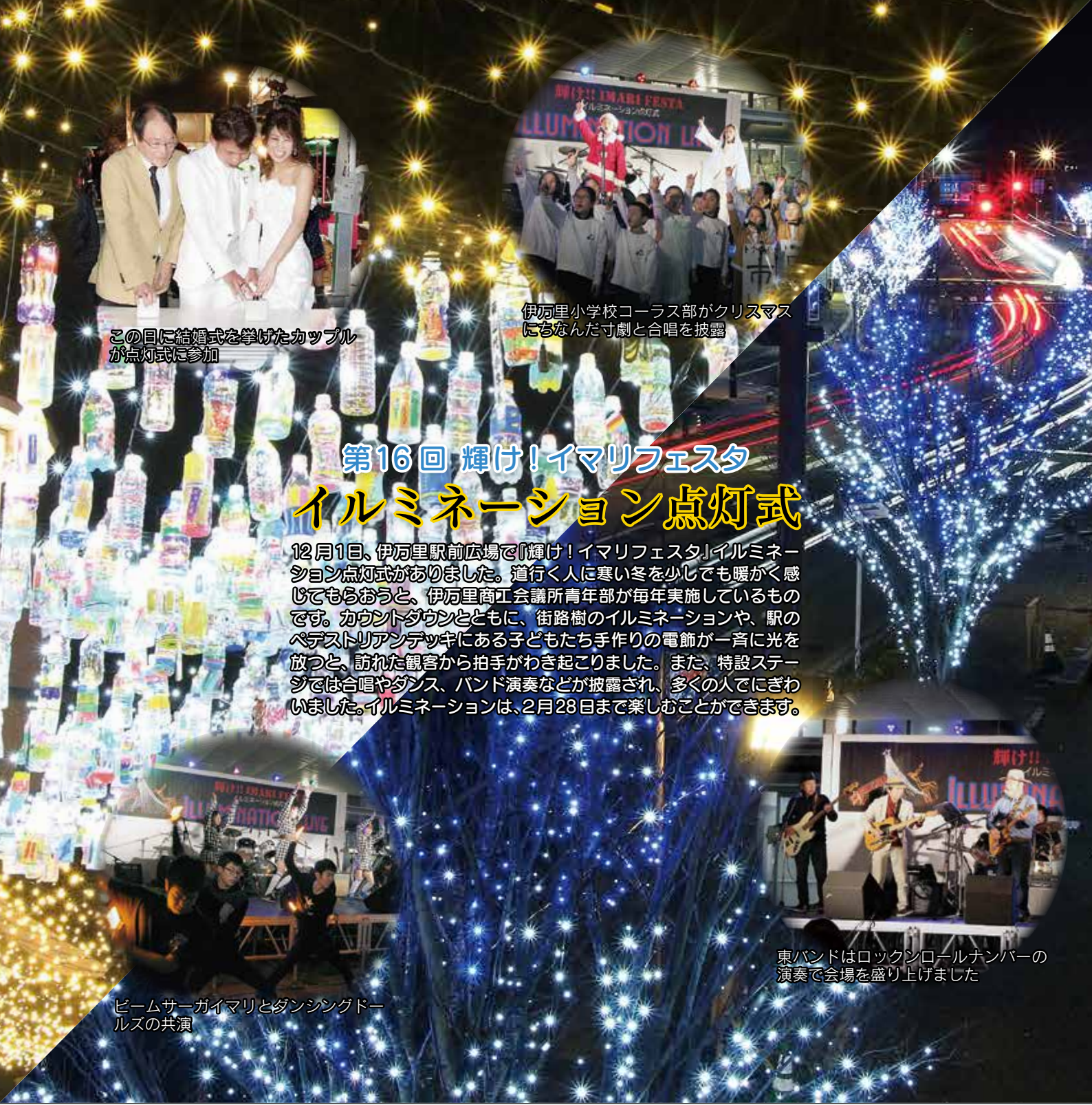
この日に結婚式を挙げたカップルが点灯式に参加