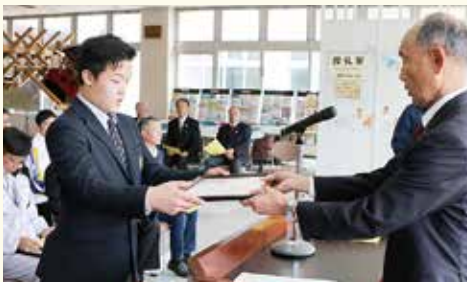
↑スポーツ賞を受賞した敬徳高等学校剣道部男子は、全国高等学校剣道選抜大会(平成30年3月開催)で3位入賞