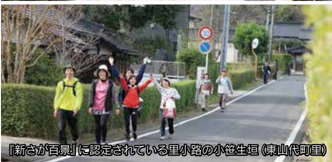
『新さが百景』に認定されている里小路の小笹生垣(東山代町里)