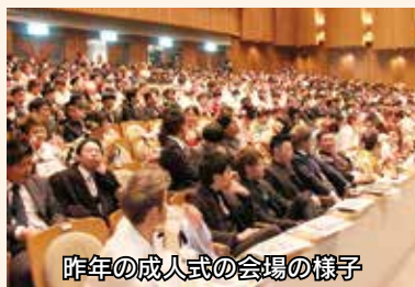
昨年の成人式の会場の様子