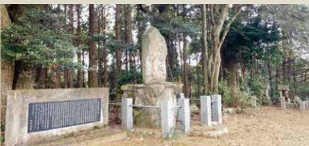
↑ 法行城跡 丘陵頂部の石碑

法行城に関する当時の史料は確認されていませんが、後世の史料によれば『古家周防守』が創建し、『久家玄番』が居城したとされています。この久家氏が実在していたことは確認されていますが、法行城との関連性は明確ではありません。