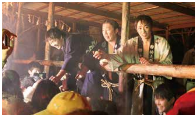
↑ 833 個の御供さんが観客にふるまわれました