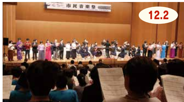
↑ フィナーレに『伊万里讃歌 第8章 終詩』を合唱する出演者と観客の皆さん

市民センターで市民音楽祭がありました。市内で活動する20団体が、合唱や吹奏楽、箏、オカリナなど多彩な音楽を披露。合同発表で各団体からの代表者が『ジングルベル』を演奏すると、会場はクリスマスの雰囲気になりました。最後は、伊万里中学校吹奏楽部の伴奏で出演者と観客が『伊万里讃歌』を合唱し、美しい歌声が響き渡りました。