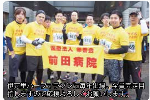
伊万里ハーフマラソンに毎年出場。全員完走目指しますので応援よろしくをお願いします。