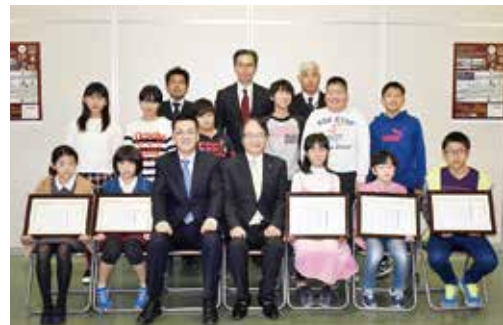
↑受賞者のみなさん