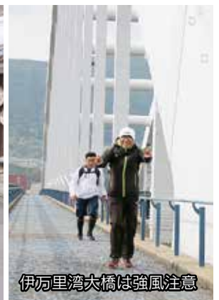
伊万里湾大橋は強風注意