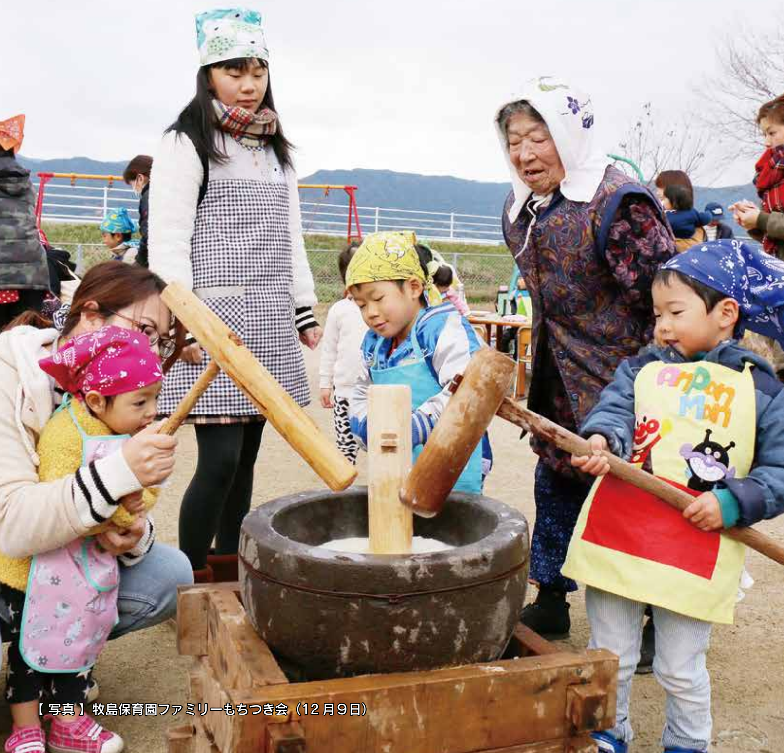
【写真】 牧島保育園ファミリーもちつき会 (12月9日)