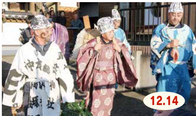
↑ 新たに選ばれ、家々を巡る世話役たち

大坪町古賀地区で、氏神様『今岳大権現』の分霊の世話役(頭)を、翌年の当番に引き継ぐ伝統行事『頭わたし』がありました。豊作に感謝し、長寿や健康を願う祭りで、『頭』は地区にある14の班が輪番で担当。くじで選ばれた新しい世話役たちは、墨を塗った顔で大権現や神主、ほら貝吹きなどの衣装をまとい、地区を巡行して各家庭に福を届けました。