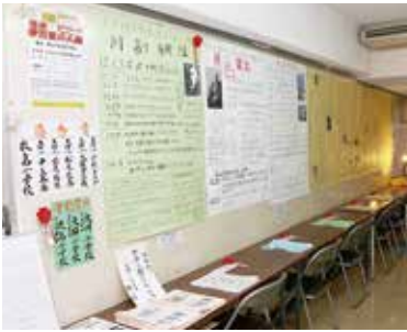
↑作品は1月20日（日）まで歴史民俗資料館で展示しています