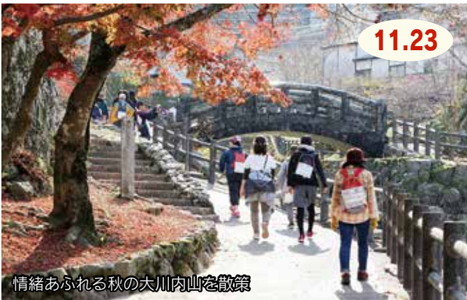
情緒あふれる秋の大川内山を散策