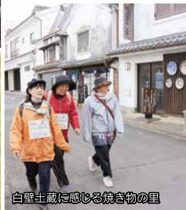
白壁土蔵に感じる焼き物の里

市内のさまざまな名所を歩いて巡る『伊万里ウオーク 2018』がありました。市内外から合わせて516人が参加。伊万里湾岸・大川内山・市街地を巡る3つのコースに分かれ、思い思いに観光名所や晩秋の風景などを楽しみました。ゴール後には温かいだご汁がふるまわれたほか、伊万里牛などの特産品が当たる抽選会なども行われました。