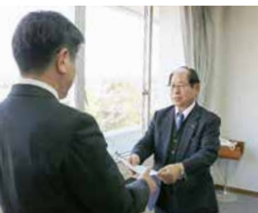
↑ 泉副市長（左）に答申書を渡す古賀会長