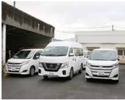
↑今回配備された車両

12月21日、九州電力株式会社 が、ストレッチャーなどが設 置されている福祉車両を市へ 5台、市社会福祉協議会へ1 台寄贈しました。これは、U PZ（緊急時防護措置を準備 する区域）の自治体が策定し ている原子力災害時の避難計 画の支援を強化するための取 り組みとして行ったものです。