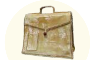
2018一般の部・鍋島大賞 『古かばん』

●問合せ先 観光課観光戦略室内 国際アマチュア陶芸展伊万里実行委員会事務局 (☎④9031)