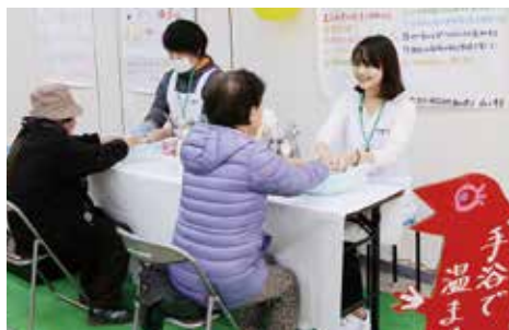
↑初出店の伊万里看護学校は、血圧測定や手浴、足浴などでおもてなし

ンジ交流館』を開きました。これは、伊万里駅前商店街振興組合が、子どもたちに就業体験の場を提供するとともに、市街地や商店に関心を持ってもらおうと、毎年取り組んでいるものです。各校はそれぞれの特徴を生