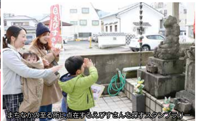
まちなかの至る所に点在するえびすさんを探すスタンプラリー