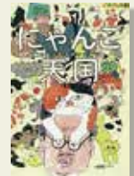
『にゃんこ天国 猫のエッセイアンソロジー』 阿部 昭/他著 河出書房新社

どの作家も観察眼が鋭く、猫に対する深い愛から、エッセイ集なのに猫の生態が分かる図鑑なのかと思うほど。すべてのページから深い猫愛が感じられ、猫好きの方にはたまらない内容となっています。