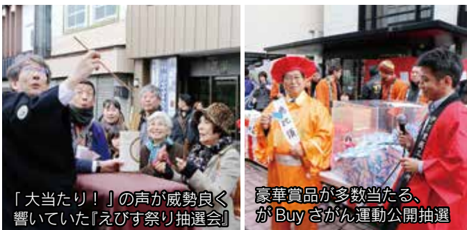
「大当たり！」の声が威勢良く響いていた『えびす祭り抽選会』

新春恒例の招福伊万里えびす祭りが中心商店街で開催されました。祭りは、宝船に乗った七福神のパレードでスタート。車エビやタイ、伊万里牛などが当たるえびす祭り抽選のほか、酒や豚汁のふるまいなどさまざまな催しが行われました。抽選会では長い行列ができ、福を呼び込もうと訪れた家族連れなど、多くの人でにぎわっていました。