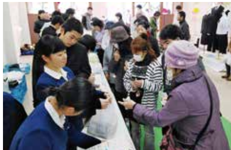
↑伊万里農林高校の生産物販売などには、開店と同時に多くの来場者が訪れました

11月3日から11月11日にかけて、伊万里・啓成中学校と伊西地区の5つの高校（伊万里商業高校、有田工業高校、敬徳高校、伊万里農林高校、伊万里高校）、伊万里看護学校が、駅前商店街の空き店舗などを活用して『スクールチャレ