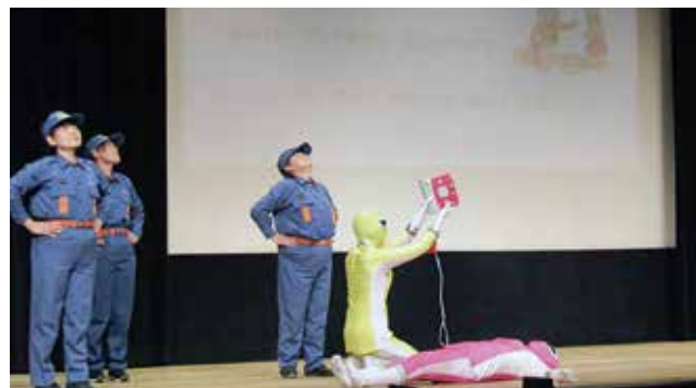
↑式典後、女性消防団によるAED使用法の啓発アトラクションがありました