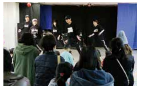
↑1月13日にはさまざまなジャンルのダンスチームが一同に集う伊万里ダンスフェスティバルを初開催

かして、自分たちの作品を展示したり、活動を紹介したりするなど、アイデアあふれる店を開きました。生徒たちは、来館者をもてなしながら、交流を深めていました。また、館内では、駅前商店街で500円以上の買い物すると抽選券が手に入る『お楽しみ抽選会』も行われ、期間中、訪れたたくさんの方々にぎわいを見せていました。