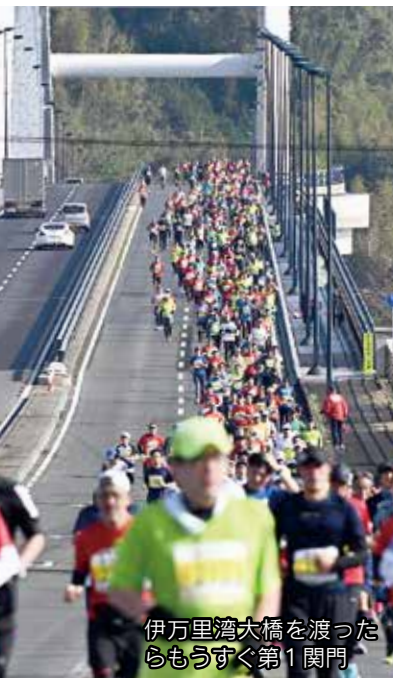
伊万里湾大橋を渡ったらもうすぐ第1関門