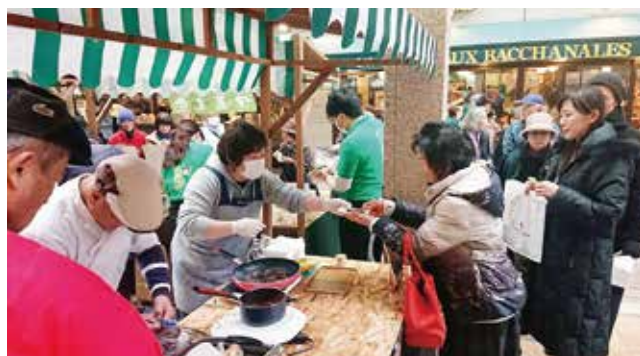
↑認定式のあと、会場では伊万里牛や伊万里のスイーツなどの特産品がふるまわれました