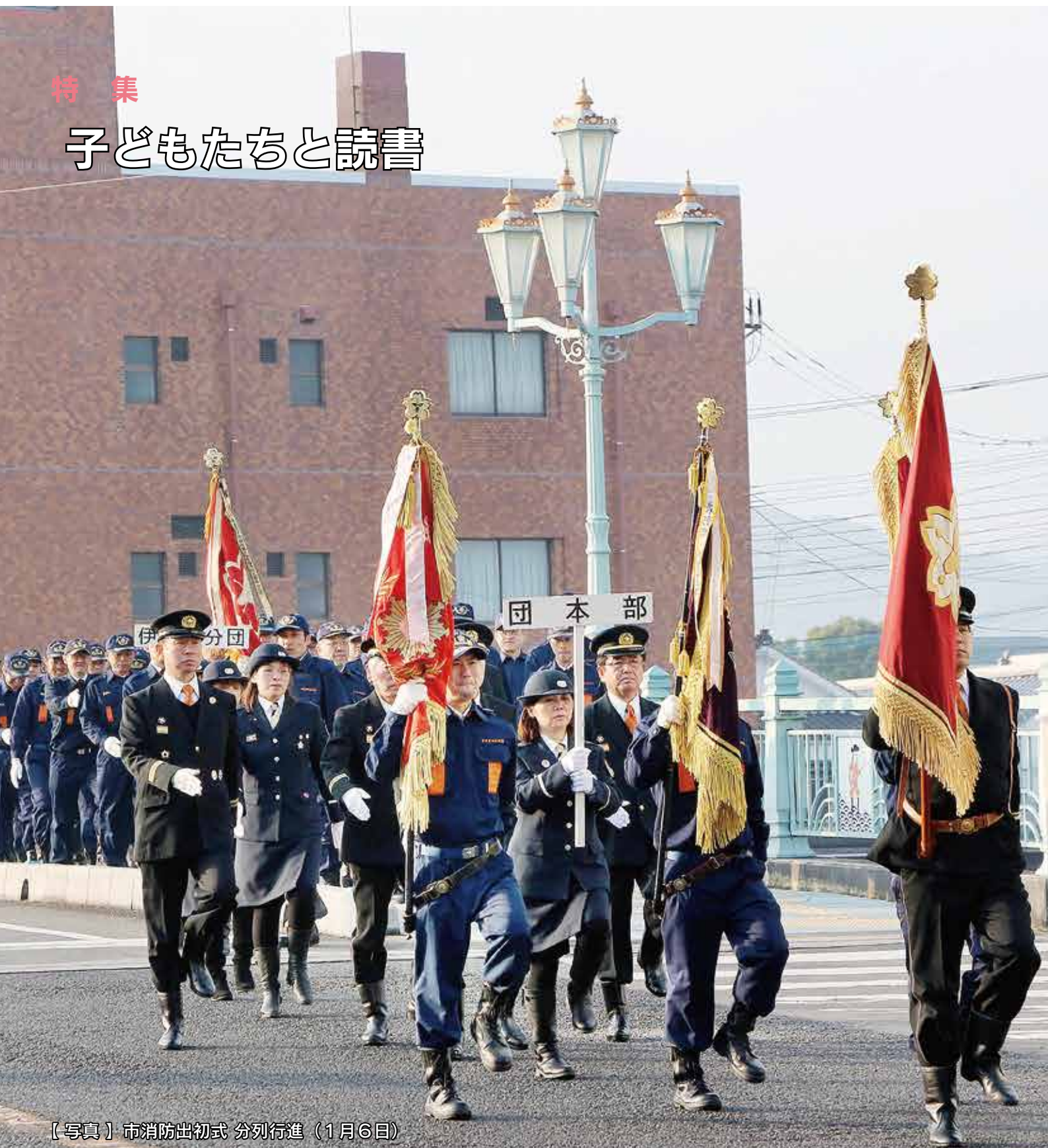
【写真】市消防出初式 分列行進（1月6日）