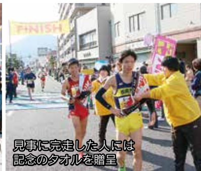
見事に完走した人には記念のタオルを贈呈