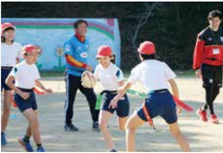
↑相手から腰につけたタグを取られると、後方にパスしなければなりません

市内で初開催となったこの日、松浦小学校の4、5、6年生が現役のラグビー部員などに教わりながら、ゲーム形式でルールを学んだ後、試合を楽しみました。初めは慣れない動きに苦戦していた子どもたちも、短時間で覚え、好プレーを連発していました。