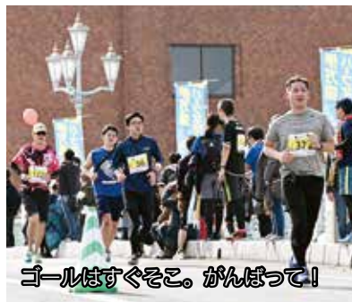
ゴールはすぐそこ。がんばって!