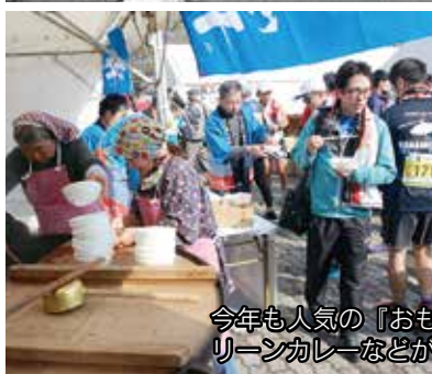
今年も人気の『おもてなし』。ゴール後のランナーに伊万里牛元氣鍋や伊万里グリーンカレーなどがふるまわれました。JALのブースにはCAの姿も