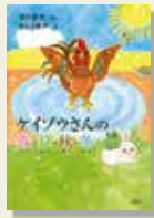
『ケイゾウさんの春・夏・秋・冬』 市川 宣子/作 さとあや/絵 講談社

にわたりのケイゾウさんの家は、幼稚園の庭にあります。冬はつらい季節ですが、ケイゾウさんは毎朝せつせと時を知らせません。ある朝、羽を広げ足を踏んぱらうとすると、足が動きません。夕べの雨が凍って足を閉じ込めています。ケイゾウさんは、くちばしで氷をたたき割り、「こけこっこー!」今朝の仕事をやりとげました。やがて、真っ白な朝がきました。