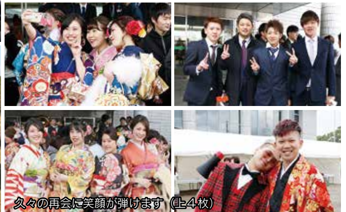
久々の再会に笑顔が弾けます（上4枚）

20 歳の門出を祝う成人式が市民センターで行われ、639 人が大人の仲間入りをしました。式典の企画や運営を行ったのは、各町（地区）から選ばれた 22 人の実行委員。5 回の話し合いを重ね、自分たちらしい式を作り上げました。会場では鮮やかな晴れ着姿の新成人たちが互いに再会を喜び合い、決意を新たに大人への第一歩を踏み出しました。