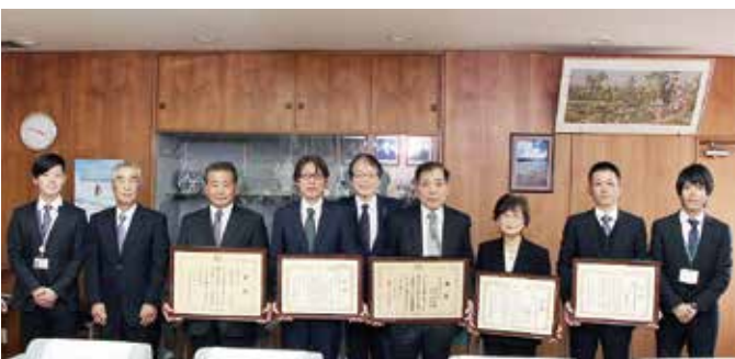
↑ 深浦市長（中央）と記念撮影をする受賞者の皆さん

深浦市長は、「農業は労力に見合う収入を得ることができ、業として成り立つものでなければならぬ。また、国土を保全するという大切な役割も担っている。どうか皆さんがリーダーとなって頑張ってください」と激励しました。