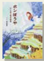
『ボンぼうや～はじめて見る世界～』 橘 春香/作・絵 PHP 研究所

ポプラの木の家に小人のチミばあさんとボンぼうやが住んでいました。チミばあさんは危険だからとボンぼうやを外に出しません。ボンぼうやは小鳥に外の世界を教えてもらいました。ある日、ボンぼうやは黙ってツバメに乗り外の世界へ旅立ちます。赤い実ころがし、アルパカの丘、さばくのまち、不思議な旅は続きます。そしてボンぼうやの帰りを待ちわびるチミばあさんのところに手紙が届きます。それは…。