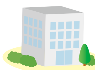
コンクリートの建物