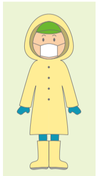
※レインコート等でも可