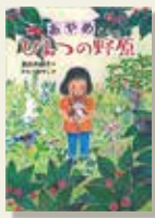
『あやめさんのひみつの野原』 島村 木綿子/作 かんべ あやこ/絵 国土社

猫のキジオがあやめさんの座布団をくわえています。あやめさんは、かりんのおばあさんの妹で、春に亡くなりました。座布団を見ると悲しくなります。キジオが「座布団に座って目をつぶって」と言つと、何かを唱え始めました。いつのまにか、かりんは満月の野原にいました。ここは、あやめさんの野原だとキジオが言つのです。