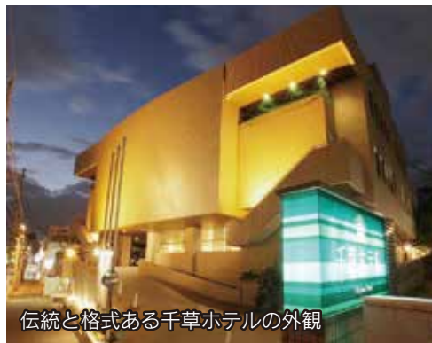
伝統と格式ある千草ホテルの外観

北九州都市圏域では初めて、伝統と格式のある『千草ホテル』において、『伊万里フェア』を開催します。 期間中は、ホテル1階のフレンチレストラン『ミル・エルブ』で、伊万里牛の希少部位などをはじめ伊 万里産の食材を活用し、フレンチの技法を駆使したスペシャルコースが、伊万里焼の皿で提供されます。 また、伊万里焼風鈴や伊万里焼の展示も楽しめます。