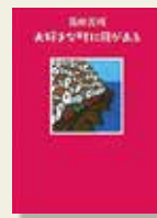
『大好きな町に用がある』 角田 光代/著 スイッチ・パブリッシング

著者は24歳のとき、予定を決めずに一人タイを旅しました。それがきっかけで、30年近くたつた今でも一人旅を続けています。旅のスタイルは時代とともに変わり、ガイドブック頼りに目的地を探していたころと違って、ネットで旅先の情報は手に入るようになり、ずつと変わりました。けれども、ずつと変わらないう旅の醍醐味は、旅をしなければ会うことのない人との出会いだとなつています。アジア、ヨーロッパ、国内を巡る旅のエッセイです。