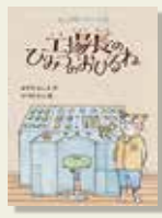
『工場長のひみつのおひるね』 みずのよしえ/作 いつのかじ/絵 偕成社

高台にある風を作る工場では、三毛猫工場長の下、町の猫たちが働いています。ある日、猫のノロ口とナツがブラリに「工場長、いつもひなたぼっこしているの」と言いました。工場長はいつも仕事熱心。その工場長がお昼寝なんて気になります。ノロ口とナツの様子に、食堂のペロリさんが声をかけました。工場長のお昼寝の秘密とは…。