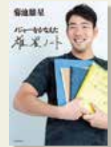
『メジャーをかなえた雄星ノート』 菊池雄星/著 文藝春秋

今年1月にメジャーリーグとなった菊池雄星。中学の頃にプロになるという夢を持ち、恩師の勧めで日記を書き始めました。書くことで、好調の日も不調の日も自分自身と向き合えたと言います。さらに目標を掲げ、書けば書くほど自分の思いが強くなってきました。この本は、当時の菊池少年が書いたありのままを掲載しています。プロ野球からさらにメジャーへと挑戦し続ける彼が、夢をかなえるために書くことの大切さを訴えます。