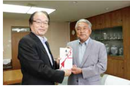
↑ 深浦市長に目録を手渡す黒川代表取締役社長（右）