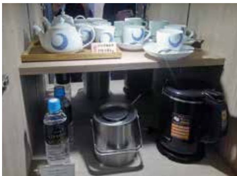
↑全客室に設置された伊万里焼ティーセット