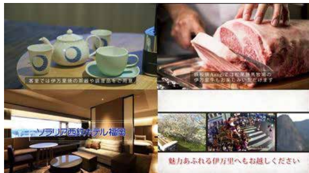
↑伊万里市のPR動画を放映しています