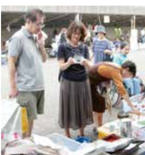
↑ 昨年のリサイクルフェアの様子