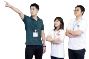
一緒に伊万里の未来を作ろう！