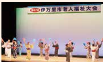
↑ 昨年の老人福祉大会の様子