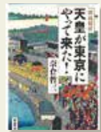
『錦絵解析 天皇が東京にやって来た!』 奈倉 哲三/著 東京堂出版