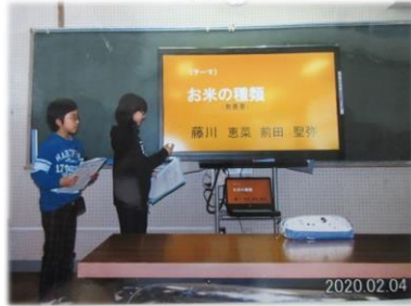
「お米の種類」について発表中