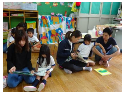
ゆい組 絵本の読み聞かせ 親子ゲーム「貨物列車」