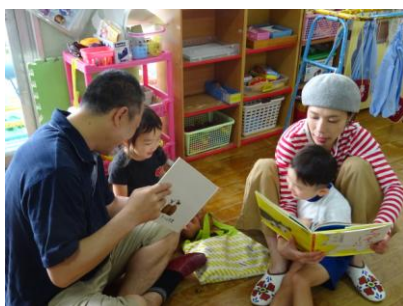
さくら組 絵本の読み聞かせ エプロンシアター