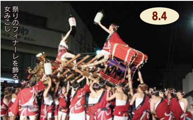
祭りのフィナーレを飾る 女みこし