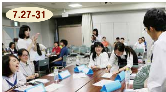
↑文学散歩で作った短歌の中から選りすぐりの一首を選ぶ生徒たちの様子（7月30日）

2019 さが総文の文芸部門が市民センターなど4か所に分かれてありました。散文、詩、俳句など5つの部門で、全国から約200人の生徒が参加。大川内山や鏡山など市内外の名所を巡る文学散歩や、佐賀をテーマに生徒が創作した作品の発表、講師から講評を聞く分科会などがあり、生徒たちは文芸を通して交流を深めていました。