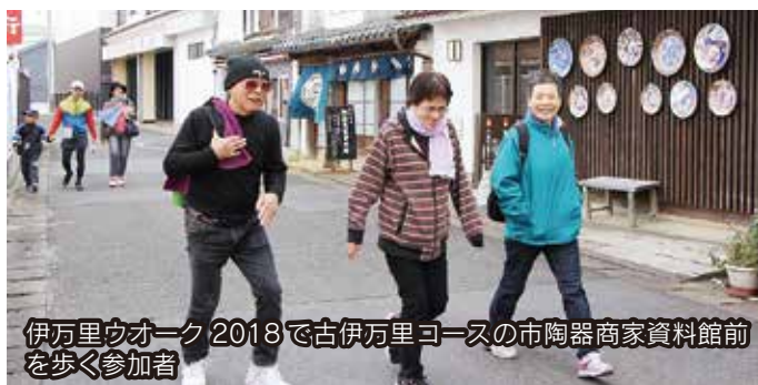
伊万里ウオーク2018で古伊万里コースの市陶器商家資料館前を歩く参加者

約6 km 午前10時スタート（受付：午前9時～） 焼物の壺がある伊万里津大橋など古伊万里 文化の漂う市街地を巡るコース