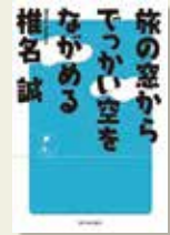
『旅の窓から つかい空をながめる』 椎名 誠/著 新日本出版社

海外の取材先で出会ったのは、大人も子どもも笑顔で温かく迎え入れてくれる人たち。一方、美人だが一切笑顔を見せることがなかった店員のいる画廊の思い出は、著者にとって苦いものとなりました。日本の島めぐり取材では、人口減少のため島外の人たちを受け入れて存続している島で、伝統文化に思いをはせるなど、旅先で大きな空を眺めながら著者が感じたままをつづった一冊です。