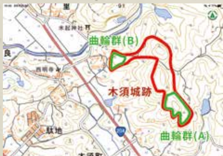
↑木須城跡周辺地図

木須城のうち、見学に適しているのは曲輪群(B)で、隣接する市道からアクセスできます。