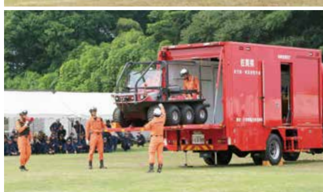
↑津波・大規模風水害対策車に搭載されている水陸両用バギー