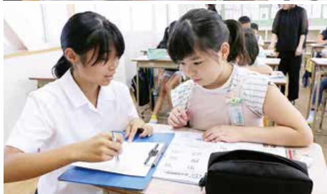
↑算数の確かめ算のやりかたを教える高校生