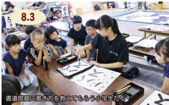
書道部員に書き方を教えてもらう小学生たち

伊万里高校で『伊高寺子屋』がありました。これは県が実施する『地域とつながる高校魅力づくりプロジェクト』の一環で、高校生が先生となり夏休みの課題に取り組む小学生のお手伝いをするものです。この日は、児童約50人が参加。持参した習字や算数などの課題を分かりやすく教えてもらった児童は「簡単にできた」と嬉しそうに話していました。