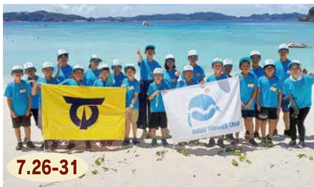
↑渡嘉敷島での海洋研修後に記念撮影

沖縄県で行われた伊万里サマーキャンプに、21人の小・中学生、高校生が参加しました。初日にひめゆり平和祈念資料館を見学した子どもたち。戦争と平和について考えました。次の日からは現地の子ども会との交流やキャンプ、海洋研修など、普段はできない体験がめじろ押し。輝く太陽とエメラルドグリーン ① の海を体中に浴びて、充実した6日間を過ごしました。