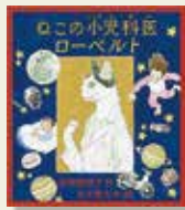
『ねこの小児科医 ローベルト』 木地雅映子/作 五十嵐 大介/絵 偕成社

ある夜、弟のユウくんが気持ち悪そうにしています。お父さんたちは電話をかけますが、どの病院もつながりません。すると電話帳の中で、小児科医松田ローベルトという番号が光ったのです。電話をかけると、すぐに小さなバイクに乗った小さな人がやってきました。「おまたせしましたあ。ローベルトでございます！」その先生は猫だったのです。