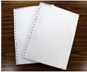
↑『麦の会伊万里』が製作した『点字広報』

『広報伊万里』の掲載内容を会員が朗読して、CDやカセットテープに吹き込み、『声の広報』として製作。毎月12人ほどのリスナーに配付しています。紙の『広報伊万里』とひと味違う『声の広報』。あなたも聞いてみませんか。※市ホームページからも聞くことが可能です。