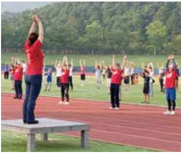
↑ 爽やかな朝、しなやかに体を動かす参加者

8月4日、国見台陸上競技場で伊万里ラジオ体操会がありました。これは、市スポーツ推進委員協議会が市民の体力づくりを目的に毎年開催しているもので、今年の参加者は130人。朝のすがすがしい空気の中、気持ちのよい汗を流しました。