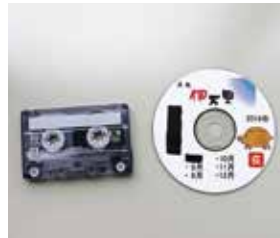
↑『伊万里こだま会』が製作した『声の広報』

すべての市民に的確な市政情報を届けることは必要不可欠なことです。目が不自由な人たちにも『広報伊万里』の内容を知ってほしい。市内では、『広報伊万里』の内容をCDなどに録音している『伊万里こだま会』、点字広報を製作している『麦の会伊万里』が長年ボランティア活動を続けています。