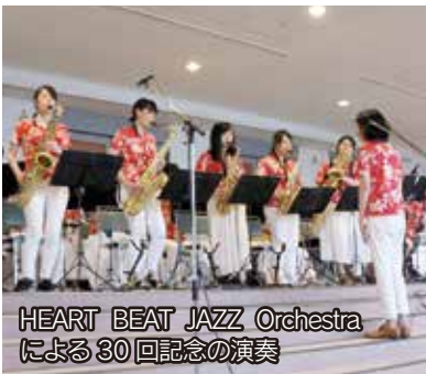
HEART BEAT JAZZ Orchestra による30回記念の演奏

市街地などで『どっちゃん祭り』がありました。暑さのため日中のステージプログラムが屋内での開催となりましたが、参加した皆さんは元気いっぱい。日が落ちた夕方からは祭りもさらに盛り上がり、市内外からの多くの人でにぎわいました。祭りの主役はなんといっても女みこし。30回目を迎えた女の祭りのフィナーレを、勇壮華麗に彩りました。