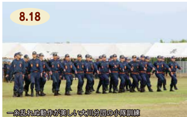
一糸乱れぬ動作が美しい大川分団の小隊訓練

市消防団夏季点検が伊万里消防署でありました。市内11分団から741人が集結。分団ごとに通常点検や小隊訓練を行い、日頃の訓練の成果を披露すると、統率の取れた機敏な動きに、観覧者は息をのんで見入っていました。また、昨年度から伊万里消防署に配備されている津波・大規模風水害対策車を使用した、負傷者の救助訓練もありました。