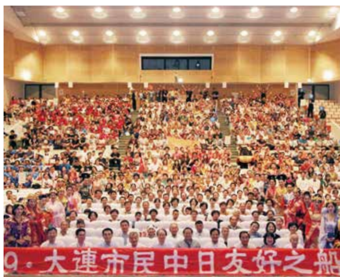
↑市民会館の観客席を埋め尽くす訪問団の皆さん

8月11日、大連市民友好交流訪問団約900人が本市を訪れ、市民会館で歓迎式典がありました。 中国大連市と伊万里市は、1987年の相互訪問を皮切りに、経済・文化・スポーツなどでの相互交流や公務研修生の受け入れなど、多岐に渡る交流を続けてきたことで、着実に良好な関係を築いてきました。このような歴史を踏まえ、来伊する訪問団を市を挙げて歓迎しようと、式典を催したものです。 この日、訪問団はクルーズ船停泊地の佐世保港からバス