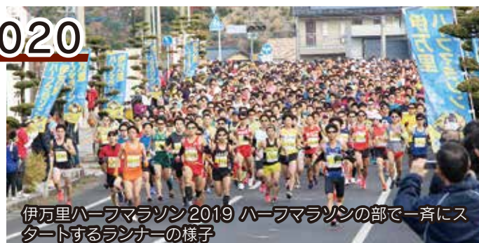
伊万里ハーフマラソン2019 ハーフマラソンの部で一斉にスタートするランナーの様子