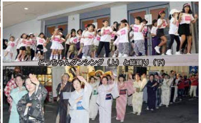
どっちゃんダンス (上) と総踊り (下)