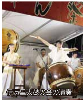
伊万里太鼓の会の演奏