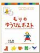
『もりのゆうびんポスト』 原 京子/作 高橋 和枝/絵 ポプラ社

小学一年生のまゆは、おじいちゃんの家遊びにきました。そして近くの森を探検です。歩いていくと『もりのともだちより』と書いた箱があり、郵便ポストのようでした。持っていたレシートに『もりのともだち』への手紙を書いてポストに入れました。次の日、森のポストへ行くとまゆへの手紙がありました。手紙は何度も読めるから嬉しいと思えます。手紙を書いたのは…。