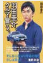
『羽田圭介、クルマを買う』 羽田 圭介/著 集英社

高校生で作家デビューを果たし、芥川賞も受賞して今や人気作家となった著者。人生の大きな買い物である自宅マンションも購入し、都心で生活をしているため車のない生活でも不自由を感じずにいます。ある心境の変化から自家用車を購入しようと思いましたが、自分と向き合いながら、ストイックに究極の一台を探す日々を綴ったドキュメントエッセイです。