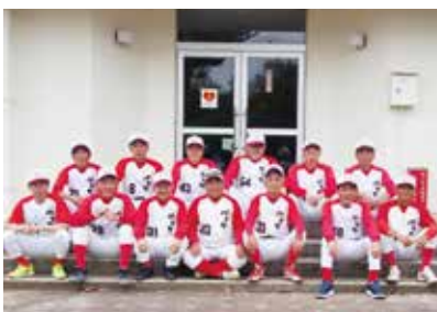
↑ 還暦チームの皆さん