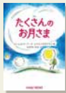
『物語 たくさんのお月さま』