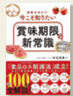
『図解早分かり！今こそ知りたい「賞味期限」の新常識』 宝島社

まだ食べることでできる食品が大量に廃棄されているという現状が問題になっています。10月1日からは『食品ロスの削減の推進に関する法律』が施行されました。本書にはさまざまな食品ごとに標準的な賞味期限が記載されています。保存状態や食品の特性によって、品質の変化の度合いは異なりますが、本賞の賞味期限を知って食品ロスの削減へつなげたいものです。