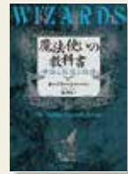
『魔法使いの教科書』 オーブリー・シャーマン/著 龍和子/訳 原書房

子どもたちの魔法使いに憧れたことはありませんか。昔話や物語の中に登場する魔法使いは多種多様ですが、この本では古今東西の魔法使いを取り上げ、魔法の世界やいろいろな魔法使いについて解説しています。光と闇になぞらえて、善と悪の象徴として描かれる魔法使いの魅力をたっぷり語ってくださるまさに『教科書』です。