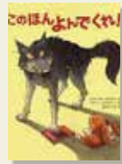
『このほんよんでくれ!』 ベネディクト・カルボネリ/文 ほむらひろし/訳 ミカエル・ドゥリュリュウ/絵 クレヨンハウス