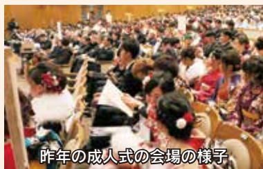
昨年の成人式の会場の様子