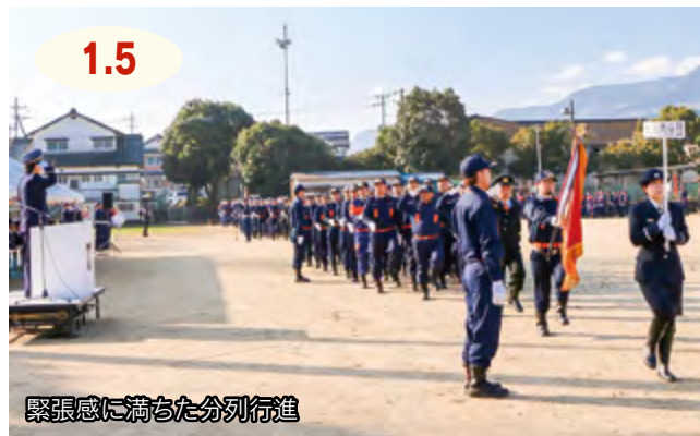
緊張感に満ちた分列行進

二里小学校グラウンドで伊万里市消防出初式がありました。参加した市内11分団の消防団員が、通常点検や分列行進で日頃の訓練の成果を披露。地域の安全・安心を守る意気込みを新たにしました。また、消防団協力事業所への感謝状贈呈や団員表彰が行われたほか、式典終了後には有田川河川敷で小型ポンプによる100口一斉放水が行われました。