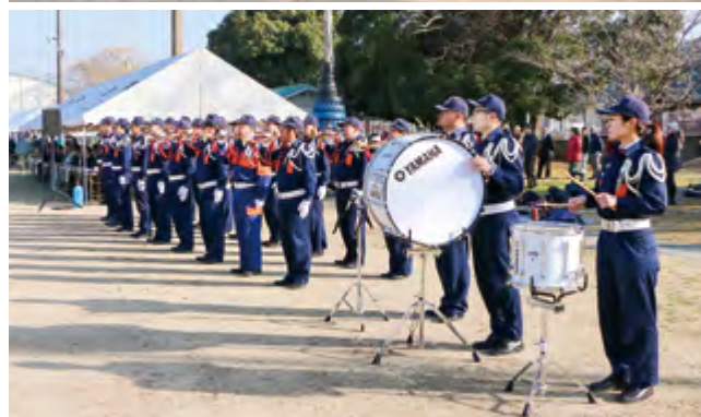
↑ラッパ隊による勇壮な演奏も披露されました