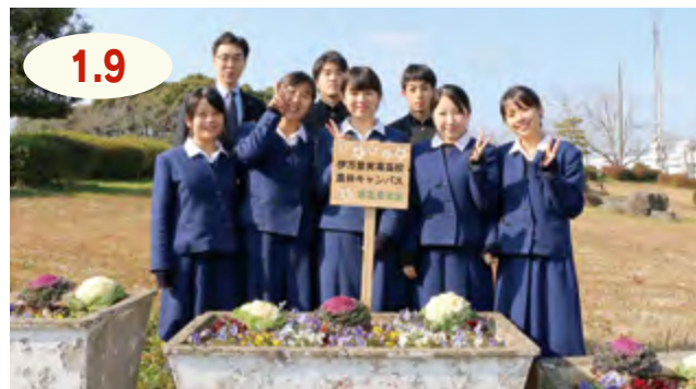
↑看板が新しくなり、色とりどりの花が咲く花壇がより一層明るくなりました

市役所前登り口にある花壇の看板が、伊万里農林高校と伊万里実業高校農林キャンパスの生徒の皆さんにより新調されました。看板には、生徒たちが伐採した演習林のひのきを使用。平成20年度から年に3回、四季折々の花を植えてもらっています。市役所のほか、市民センターなどにも植栽をしてくれている生徒たち。足を止め、見てみませんか。