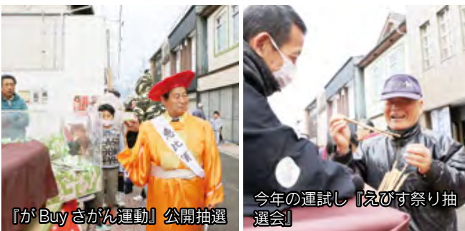
『がBuyさがん運動』公開抽選