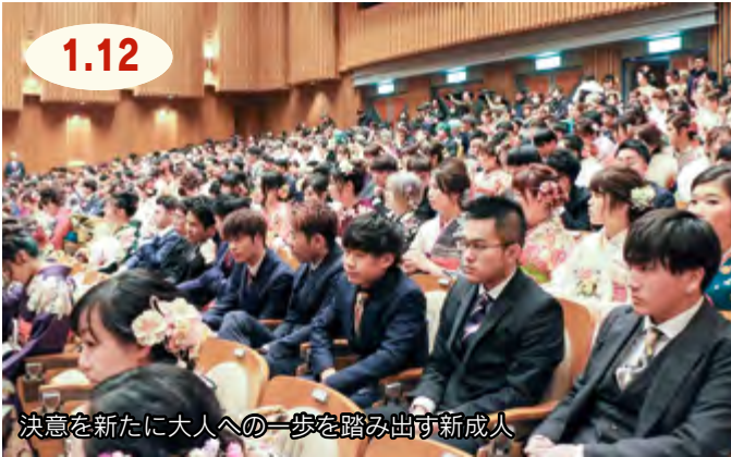
決意を新たに大人への一歩を踏み出す新成人