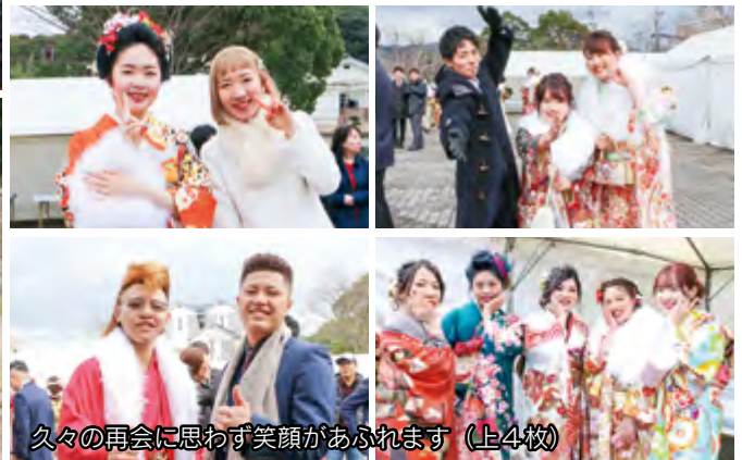
久々の再会に思わず笑顔があふれます(上4枚)

20歳の門出を祝う成人式が市民センターで行われ、653人が大人の仲間入りをしました。式典の企画や運営を行ったのは、各町(地区)から選ばれた21人の実行委員。昨年7月から話し合いを重ね、思い出に残る成人式を作り上げました。会場では振り袖やスーツ姿の新成人が久々に会う友人との再会を喜び合ったり、記念撮影をしたりしていました。