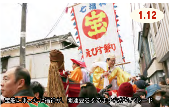
宝船に乗った七福神が、開運豆をふるまいながらパレード

商売繁盛と開運・招福を願って、中心商店街で新春恒例の招福伊万里えびす祭りが開催されました。七福神パレードや、車エビやタイ、伊万里牛などが当たるえびす祭り抽選のほか、豚汁やお酒のふるまいなどさまざまな催しが行われました。抽選会では長い行列ができ、福を呼び込もうと、訪れた家族連れなど多くの人でにぎわいました。