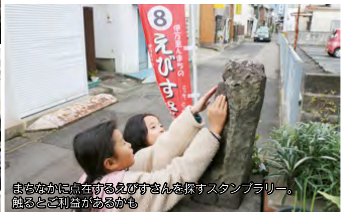
まちなかに点在するえびすさんを探すスタンプラリー。触るとご利益があるかも