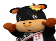
いまりんモーモちゃん

〒848-0045 佐賀県伊万里市松島町391-1 TEL:0955-22-3916 FAX:0955-22-3970