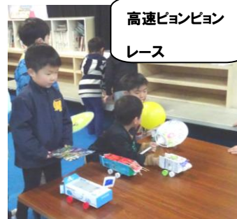
高速ピョンピョン レース

「高速ピョンピョンレース」「どうぶつなんでも跳ぶ」の6つの遊ぶコーナーがあり、子供たちは2年生に遊び方を教わりながら楽しく遊んでいました。当日は雨が降っていたのに、うっかりしてシューズを持って行くのを忘れていました。小学校で借りた大人用のスリッパを履いて階段を上げるのに四苦八苦。それを見て、2年生の子は幼稚園の子の足を片足ずつ持ち上げて階段を上らせてくれました。その姿、優しさに感動でした。