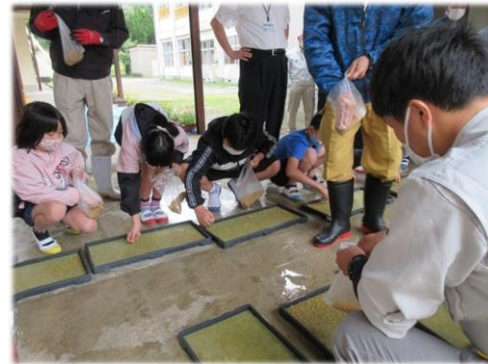
上手に蒔けるかな