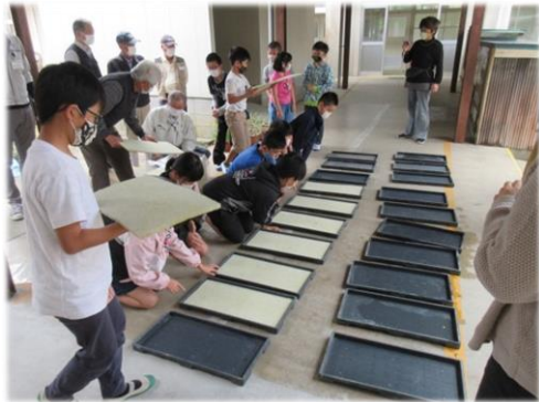
苗箱にシートをはって…

たくさんのお米を学んで、立派なお米が収穫できますように。発表会も今から楽しみです。