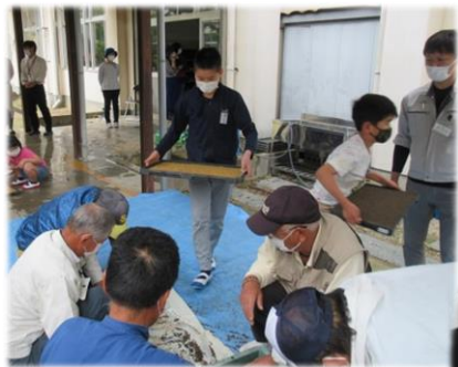
水分たっぷりの苗箱は重たいね!