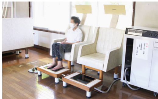
↑設置された電位治療器

題を提供してもらい、大変ありがたい。電位治療器は、高齢者が老人憩の家を利用するきっかけとなつてほしい」とお礼を述べました。