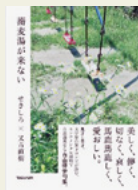
『蕎麦湯が来ない』 せきしろ / 著 又吉直樹 / 著 マガジンハウス

五・七・五の形をとらず、自由な韻律で詠み、季語も必要としない自由律俳句。本書は、2人の個性的な著者が詠んだ404句と散文を収録しています。日常の中にある驚き、喜び、哀しみ、嫉み。そして哀愁。それらの一つ一つにフォーカスをあてた言葉を追っていくうちに、「ああ、あるある」と思い出す感情があり、通り過ぎていく風景に隠されている小さな感動を発見します。