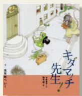
『キタマッチ先生4 ~先生町へいく~』 今井 恭子 / 文 岡本 順 / 絵 BL出版