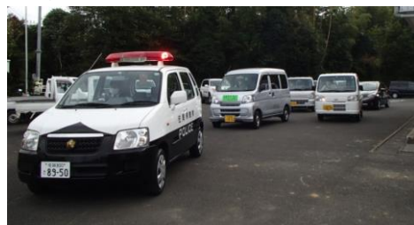
10月9日(金)に「全国地域安全運動」に合わせて、地域の防犯パトロールを行いました。(区長会・伊万里警察署)

少しの時間でも、自宅の駐車場でも、車を離れるときには窓を閉め、ドアロックをしましょう！また、自宅についても、出かける際は必ず施錠し、被害を未然に防ぎましょう！