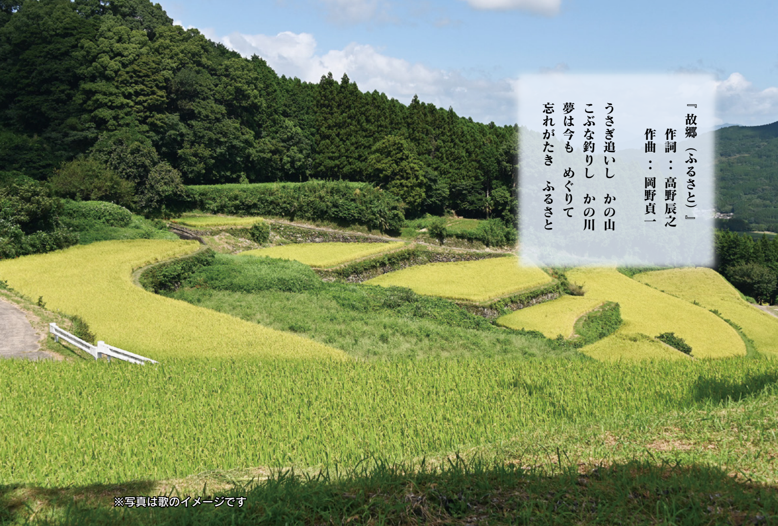
※写真は歌のイメージです

『故郷（ふるさと）』 作詞：高野辰之 作曲：岡野貞一 うさぎ追いし かの山 こぶな釣りし かの川 夢は今も めぐりて 忘れがたき ふるさと