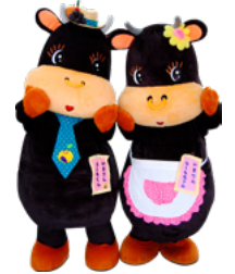
市マスコットキャラクター いまりんモーモくん・いまりんモーモちゃん