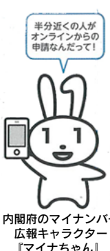
内閣府のマイナンバー広報キャラクター「マイナちゃん」