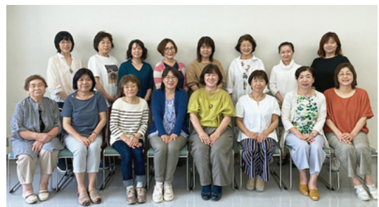
↑母子健康推進員の皆さん。笑顔と安心感を届けるように心がけています