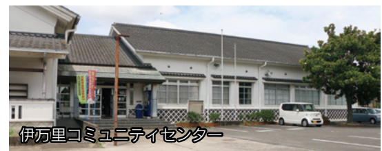
伊万里コミュニティセンター