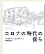
『コロナの時代の僕ら』

私たちは、今までに経験したことのない禍の中にいます。新型コロナウイルス感染症は、今までの考え方も暮らし方も、そして、人との関わり方も、すっかり変えてしまいました。私たちはこの先ずっと、毎日祈り、怯え、新しいアクションを諦めるしかないのでしょうか。これからのコロナの時代を生きたため、人が人らしく生きていくことを教えてくれる、イタリヤ発のエッセイ集です。