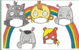
↑ 温かい思いやりの心を持つことの大切さを教えてください。

今、大切にしなければならないことは、どのようなことなのか、子どもも大人も考えることができる道徳の学習教材です。