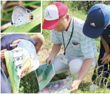
↑タイワンツバメシジミの特徴を聞く生徒

9月8日、南波多町の大野岳山頂付近で、大野岳タイワンツバメシジミ保存会と南波多郷学館の生徒22人によるタイワンツバメシジミの観察会がありました。平成29年に山頂付近の繁殖地が市天然記念物に指定されたタイワンツバメシジミ。成虫の出現頭数が多い9月上旬に観察会を開催しており、今年で3回目です。産卵場所には幼虫の餌となるシバハギが必要なことから、同校は繁殖地の保護活動でシバハギを種から育てています。この日生徒たちは、同会による成虫や幼虫、卵の特徴の説明を受け探索。あいにく見つけることができませんでしたが、活動を通して郷土を愛し自然を守ることの大切さを学びました。