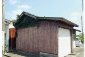
↑ 旧漁港市営住宅敷地予定地の建物 (正面)