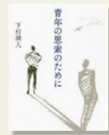
『青年の思索のために』 下村湖人/著 ごま書房新社

中国の逸話や戦争体験者の話、自身の経験などから、これを生きていく若者に向けて、厳しく、そして温かい言葉がたくさん綴られています。若者に限らずすべての人にとって人生の指針となる文章が詰まった一冊です。