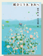
『紙ひこうき、きみへ』 野中 柊/作 木内達朗/画 偕成社

朝、森に吹き渡る風の音を聞いたとき、シマリスのキリリは、今日は特別なことがあると思ってきました。風に乗れり何かが飛んできて、こつん。キリリの頭に当たりました。青い紙ひこうきでした。開くと「夕方には、そちらにつきます」と書いてありました。分らないけれど、お客さんが来るのです。キリリは一緒に食べようと、パンやスープを作りました。夕方になって、「きみだね？」と声が…。