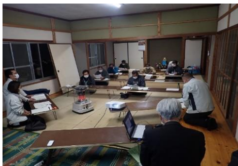
(地域説明会の様子)