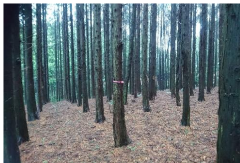
(標準地調査の様子)