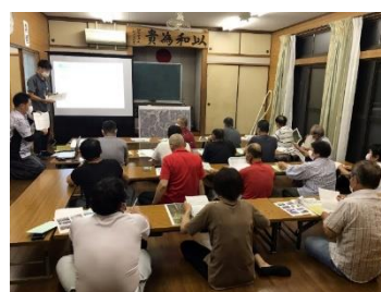
（事業2：説明会の様子）