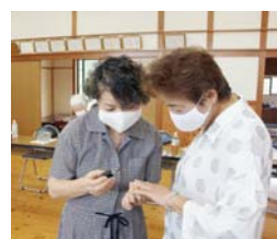
↑ネイルを塗って『おしゃれ』を楽しむ

会の名前は、気楽に集まって楽しんでもらおうという思いから付けられました。この日は、ネイル体験でおしゃれを楽しみました。輪投げでリフレッシュしたあとは、みんなで童謡を歌いました。