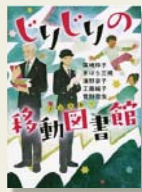
『じりじりの移動図書館』 廣嶋玲子 ほか/著 講談社

健太が住む村に、移動図書館が来てくれる。本の返却を頼まれた健太は、車を待っていた。じりじり！鳴り響く音とともに、移動図書館『ミネルヴァ』がやってきた。白いひげのおしゃれな館長さんと黒い制服姿の女性の運転手。車のドアを開けたら本がぎゅっ！そこに図書館が現れる。本に惹きつけられた健太は中に入り込み、一冊の本にどきどきとした。がたん。その時、移動図書館が走り出したのだ。