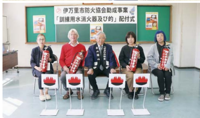
↑訓練用水消火器および的を受け取った保育園などの皆さん