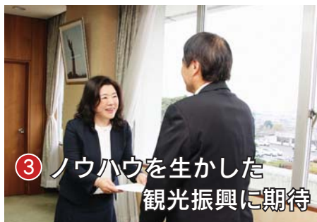
③ ノウハウを生かした観光振興に期待