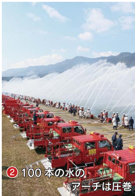
② 100本の水のアーチは圧巻