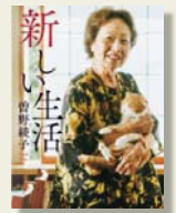
『新しい生活』 曾野綾子/著 ポプラ社

著者自身、人生の節目ごとに新しい生活を試みては、決意どおりにはいかなかったと語りま。半生を情性で生きてきたと言いつつも、その特性が大きくなると罪を犯すことにつながらなくてよくなったというおもしろさは、生きていくうえで、ぜひ身に付けておきたいものです。 173個に及ぶ見出しに沿って、短めの、時には数行で終わるエッセイが連なっています。90年の人生を生きてきた力のある言葉に触れてみませんか。