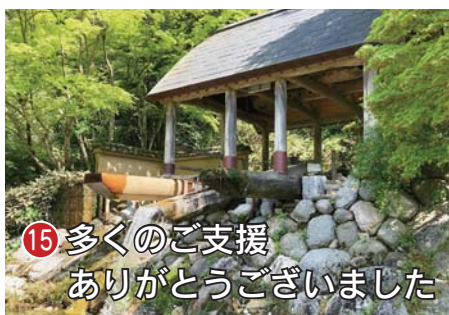
15 多くのご支援ありがとうございました