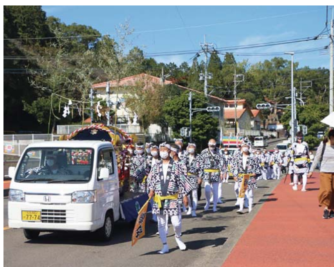
↑軽トラックに神輿を載せて幸橋を渡る氏子たち

10月25日、市街地で伊万里の秋の風物詩、伊万里神社御神祭『伊万里トントン』の本祭がありました。通常4日間の日程を、新型コロナウイルス感染症の感染拡大防止のため、2日間に規模を縮小して開催されました。 担ぎ手が密集・密接するのを避けるため、荒神輿と団車が組み合う合戦を中止し、巡幸も4基の神輿を軽トラックに載せて実施。天気にも恵まれたこの日、伊万里神社を出発した約200人の氏子たちは、伊万里商工会議所前広場までの約1時間を往復しまし