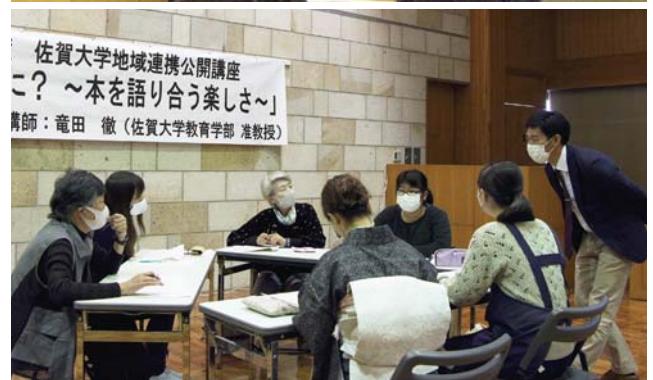
↑演習で1冊の本について語り合う参加者たち