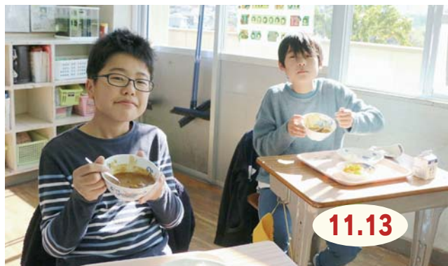
↑佐賀牛カレーを味わう立花小学校6年1組の児童

市内の小・中・義務教育学校などで、佐賀牛を使った学校給食が提供されました。これは、県の『食べて応援！佐賀牛学校給食提供事業』を活用し、コロナ禍の中で販売が落ち込む肉用牛農家を支援しようと実施されたものです。この日、子どもたちは佐賀牛カレーを堪能。来年1月と3月にも佐賀牛を使った給食がふるまわれる予定です。