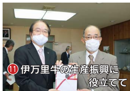
11 伊万里牛の生産振興に役立てて