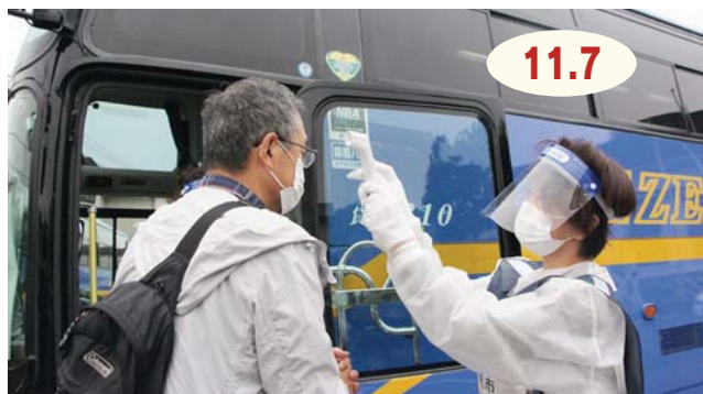
↑新型コロナウイルス感染症のような感染症が流行したときを想定し、乗車前に体温を測定

九州電力株式会社玄海原子力発電所（玄海町）の重大事故を想定した県原子力防災訓練が実施され、伊万里・牧島地区の住民が参加しました。各コミュニティセンターに集合した約50人の参加者は、避難を想定して有田町にバスで移動し、避難の手順を確認したり、放射線の基礎知識について学んだりして、防災の備えを体験しました。