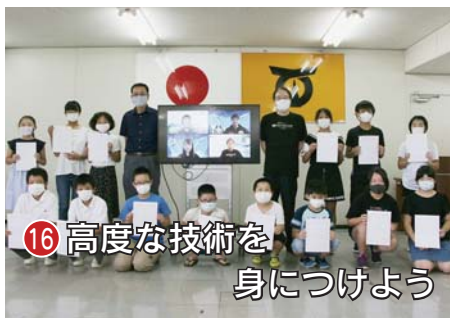
16 高度な技術を身につけよう