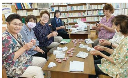
↑交通安全のマスコット人形を作る大川老人クラブの会員

各町クラブで、コミュニティセンターの清掃や花壇の花植え、草取りなどを行っています。また、市民の交通安全を願って、マスコット人形を手作りしています。今年は、新型コロナウイルス感染症の感染拡大防止のために、手作りマスク 200 枚を作り、市に寄贈しました。