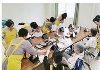
↑福祉施設での化粧品セラピー

平成12年頃に、化粧品会社の活動に参加して、自分たちも同じような活動をやりたいと思い、メイクのしかたを教わりながら知人に声をかけ、メンバーを増やしました。福祉施設を訪問し、高齢者にメイク体験をしてもらう『お化粧品セラピー』を行っています。年齢を重ねてもおしゃれを楽しんでほしい、メイクを体験して笑顔になってほしいと思って活動を続けています。