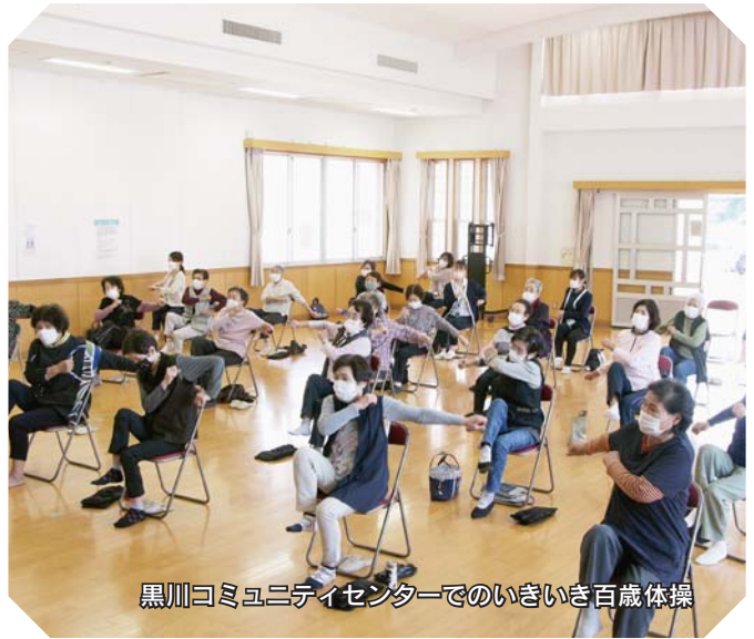
黒川コミュニティセンターでのいきいき百歳体操