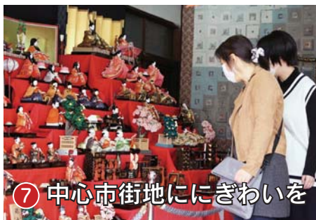
⑦ 中心市街地ににぎわいを