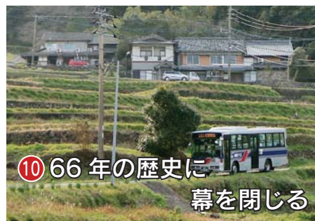
10 66年の歴史に幕を閉じる