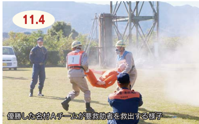
優勝した名村Aチームが要救助者を救出する様子

伊万里消防署で火災初動対応競技大会がありました。市防火協会などに加入する市内の7事業所10チームが参加し、119番通報や要救助者の救出などの迅速さや確実さを競いました。そのほか、市内保育園などへの訓練用水消火器および的の配付式を開催。消火技術の向上と幼少期から防火意識を高めるために、今年度から隔年で配付されます。