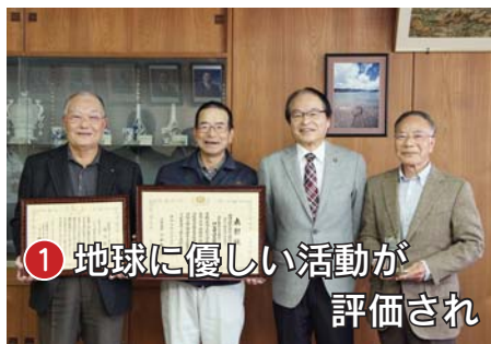
① 地球に優しい活動が評価され