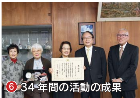
⑥ 34年間の活動の成果