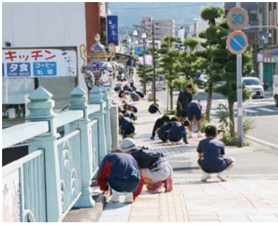
↑相生橋を磨く児童・生徒

啓成中の全校生徒と伊万里小6年生および牧島小の5・6年生の児童合わせて約360人が参加。松島東交差点から伊万里駅通商店街までの両側の歩道に付いた汚れを取りました。学校の垣根を越えた60の班に分かれ、あらかじめ割り振っておいた担当工