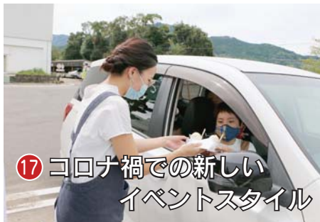
17 コロナ禍での新しいイベントスタイル