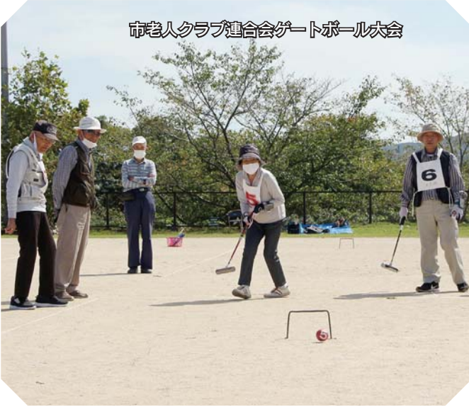
市老人クラブ連合会ゲートボール大会