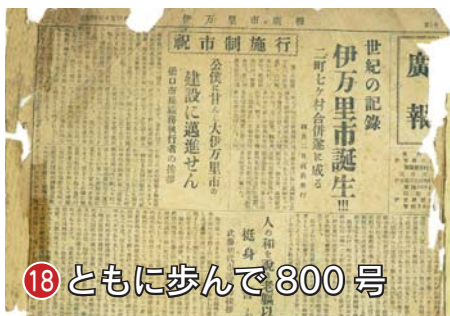
18 とともに歩んで800号