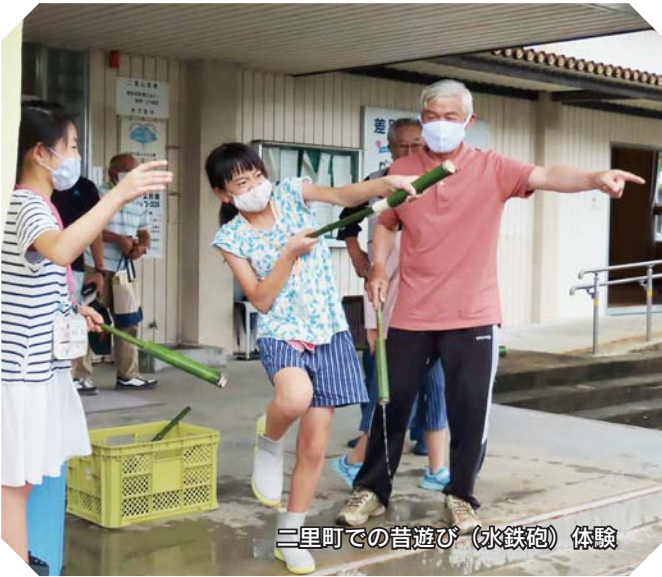
二里町での昔遊び（氷鉄砲）体験