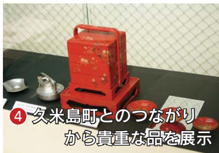
④ 久米島町とのつながりから貴重な品を展示

令和2年（2020年）もあとわずかです。喜んでよいと思っています。あなたにとって、この1年ほどのような年でしたか。 私たちが住む伊万里市でも、たくさんの方の出来事や話題がありました。ここでは、『広報伊万里』をもとに、市の1年を振り返ってみます。