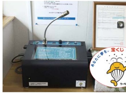
↑整備された無線屋外放送設備