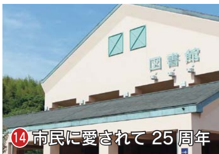
14 市民に愛されて25周年