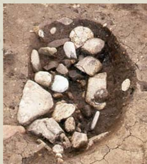
↑石で覆われた状況