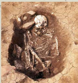
↑石を取り除いた状況（屈葬）

大地に回歸する説などがありますが、胸に石を抱かせる埋葬方法（包石葬）もあることから、死者から霊が遊離しないよう手足を曲げて霊を封じ込める説も有力な説の一つとなっています。