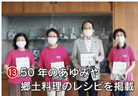
13 50年のあゆみや郷土料理のレシピを掲載