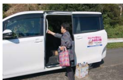
↑市社会福祉協議会の車

市社会福祉協議会のワゴン車で利用者の自宅まで迎えに行き、松浦町内の店舗や市街地のスーパーなどを回ります。買い物のあとは、自宅まで送ります。