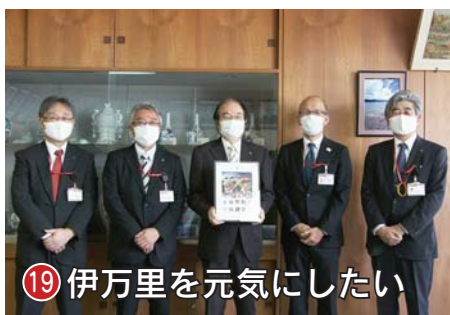
19 伊万里を元気にしたい