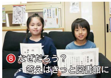
8 なぜだろう？ 答えはきっと図書館に