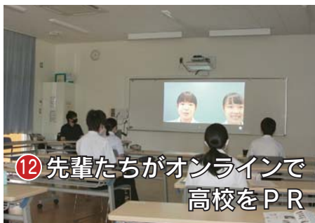
12 先輩たちがオンラインで高校をPR