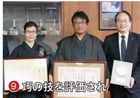
9 巧の技を評価され