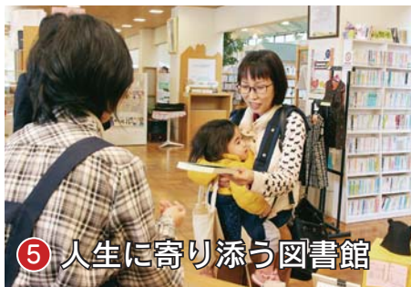
⑤ 人生に寄り添う図書館