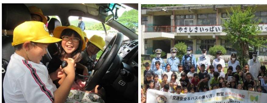
パトカーの無線マイクに大興奮！