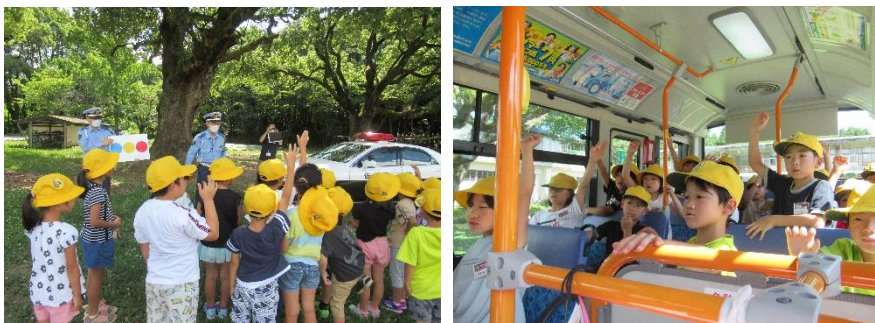
大川町に信号機はいつあるかな？

7 月 14 日に、大川小学校にて、子どもたちへの交通安全教育と公共交通の利用促進を目的とした、「交通安全教室」と「バスの乗り方教室」が行われました。クイズコーナーでは手を上げて元気いっぱいクイズに参加したり、パトカーの乗車体験をしたりと、交通安全について楽しく学習しました。関係者の皆様、暑い中お疲れ様でした。