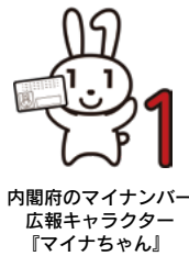
内閣府のマイナンバー広報キャラクター「マイナちゃん」

1月から3月にかけて、マイナンバーカードのオンライン申請に必要なQRコード付きの交付申請書が自宅へ郵送されます。マイナポイントの付与や健康保険証としての利用など、利便性が向上するマイナンバーカードをこの機会に申請してください。