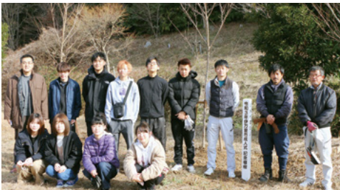
↑大川内造園の皆さん(右から3人)と記念植樹した成人式実行委員(1月16日撮影)