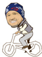
俳優の野正平さん

3月8日(月)必着 ●問合せ NHKふれあいセンター (☎0570066066) または (☎05037865000)