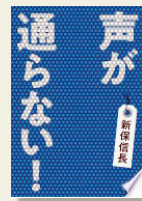
『声を通らない！』 新保 信長/著 文藝春秋

居酒屋で店員に声を通らないというコンプレックスを持つ著者が、体を張って調べてみました。いい声といわれる芸能人、発声のよいアナウンサー、ライブで雄たけびをあげるアイドルの追っかけなどに会ったり、さらに、ボイストレーニングに通い、著者が出した結論とは？ 声と喉にまつわる取材と体験がギュッと詰まったユニークな一冊です。