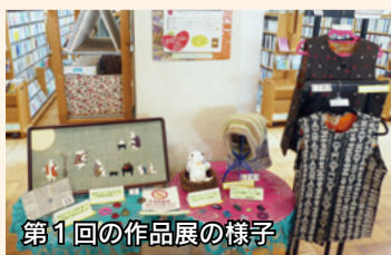
第1回の作品展の様子