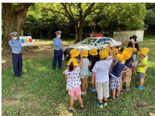
小学生を対象とした交通安全教室