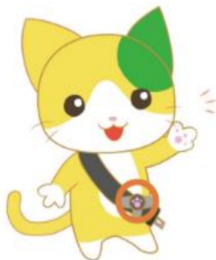
佐賀県交通安全 キャラクター 「マニャー」