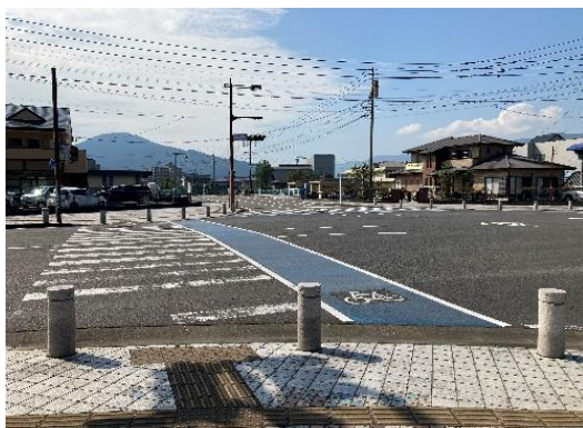
交差点内の交通安全施設の例 (自動車侵入防護対策)