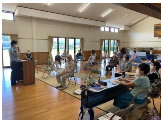
高齢者を対象とした交通安全教室