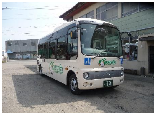
ノンステップバス車両 (いまりんバス市街地線)