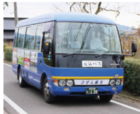
↑ 東山代町元気バス