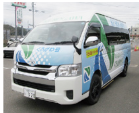
↑ 町内巡回バスくろがわ号