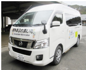
↑ 波多津ふれあい号

お披露目会当日は、市内で活躍する地元住民組織などで運営されている『コミュニティバス』も市民センターに展示します。