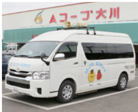
↑ 大川町コミュニティすこやかバス