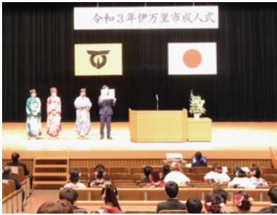
↑市成人式市民センター会場の様子（1月10日開催）

この結果、対象年齢はこれまでどおり『20歳』と答申されました。最終的に市の方針を決定するにあたり、市民皆さんの意見を募集します。