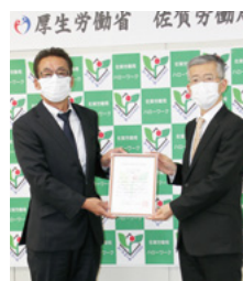
↑ 前川代表取締役社長（左）