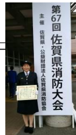
第67回 佐賀県消防大会 主催：佐賀県・公財団法人佐賀県消防協会