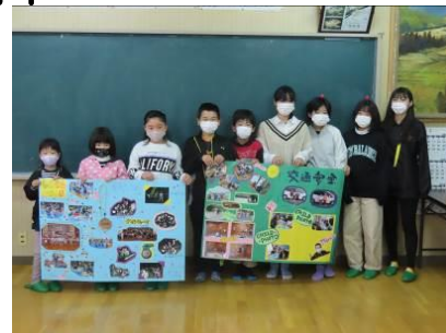
ご協力いただいたみなさん、ありがとうございました。

●問合せ先 東山代町子ども会連合会事務局(東山代コミュニティセンター内) ☎28-0001