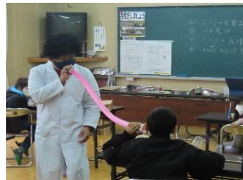
(聞こえるかな?〔風船電話〕)

●問合せ先 まちづくり協議会事務局(東山代コミュニティセンター内) ☎28-0001