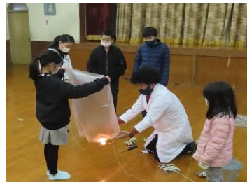
(気球を上手く飛ばせるかな?)