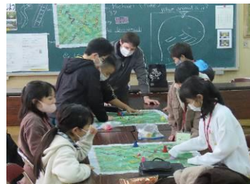
(すごろくゲーム。誰が一番かな?)