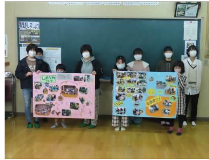
ご協力いただいた皆さん、 ありがとうございました

●問合せ先 子ども会連合会事務局(東山代コミュニティセンター内) ☎28-0001