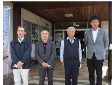
就任された区長さん、よろしくお願いします。