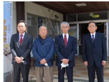
退任された区長さん、お疲れ様でした。