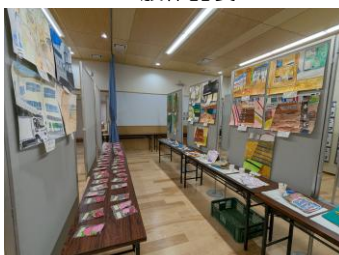
児童・生徒作品展