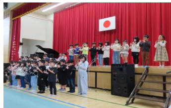
東山代小学校3年生