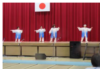
伊万里市武術太極拳連盟長浜支部