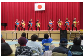
リズム・ダンス明星会