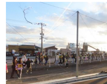
スタート直後の様子

●問合せ先 スポーツ協会事務局（東山代コミュニティセンター内） ☎28-0001