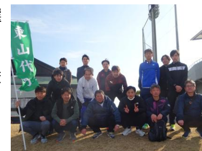
選手の皆さん、お疲れ様でした。