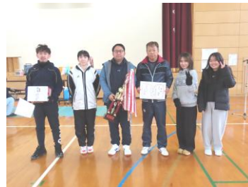
優勝した脇野チームの皆さん